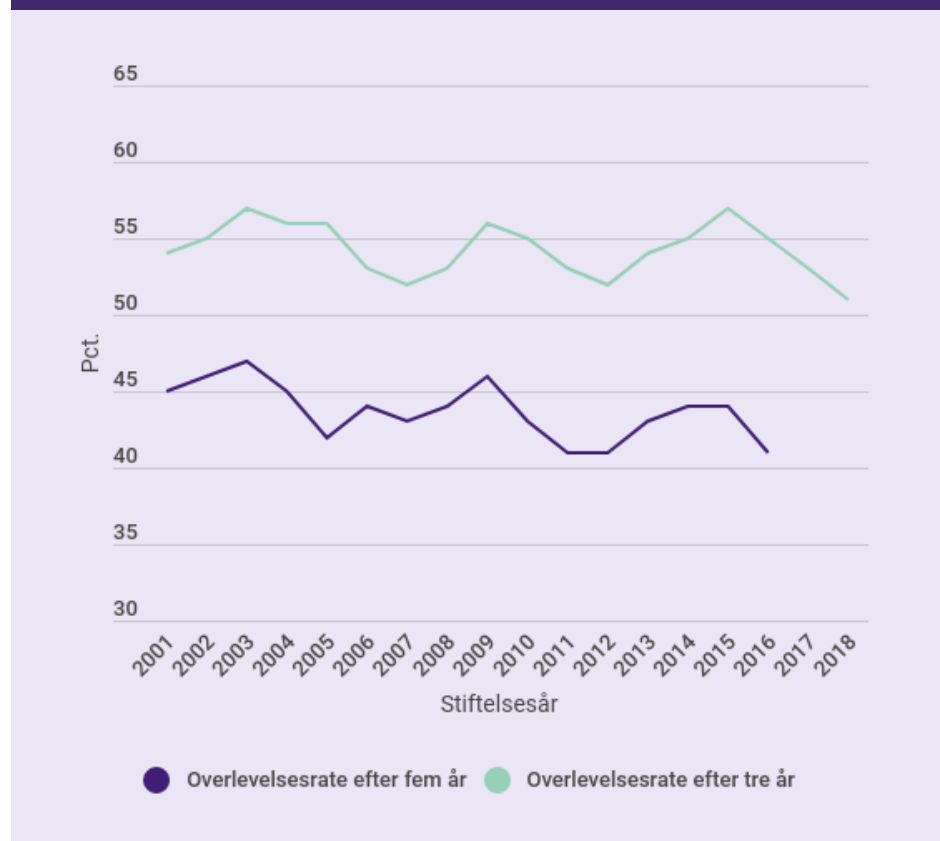
Overlevelsesraten for 3-årige og 5-årige virksomheder ud fra stiftelsesår.

For de 5-årige virksomheder stiftet i perioden 2001-2016 er den negative trend større. Virksomheder stiftet i 2001 havde en overlevelsesrate på 45 pct. efter 5 år, mens den i 2016 var reduceret til 41 pct. Dette niveau placerer Danmark i midten af EU-27 målt på overlevelsesraten for 5-årige virksomheder.