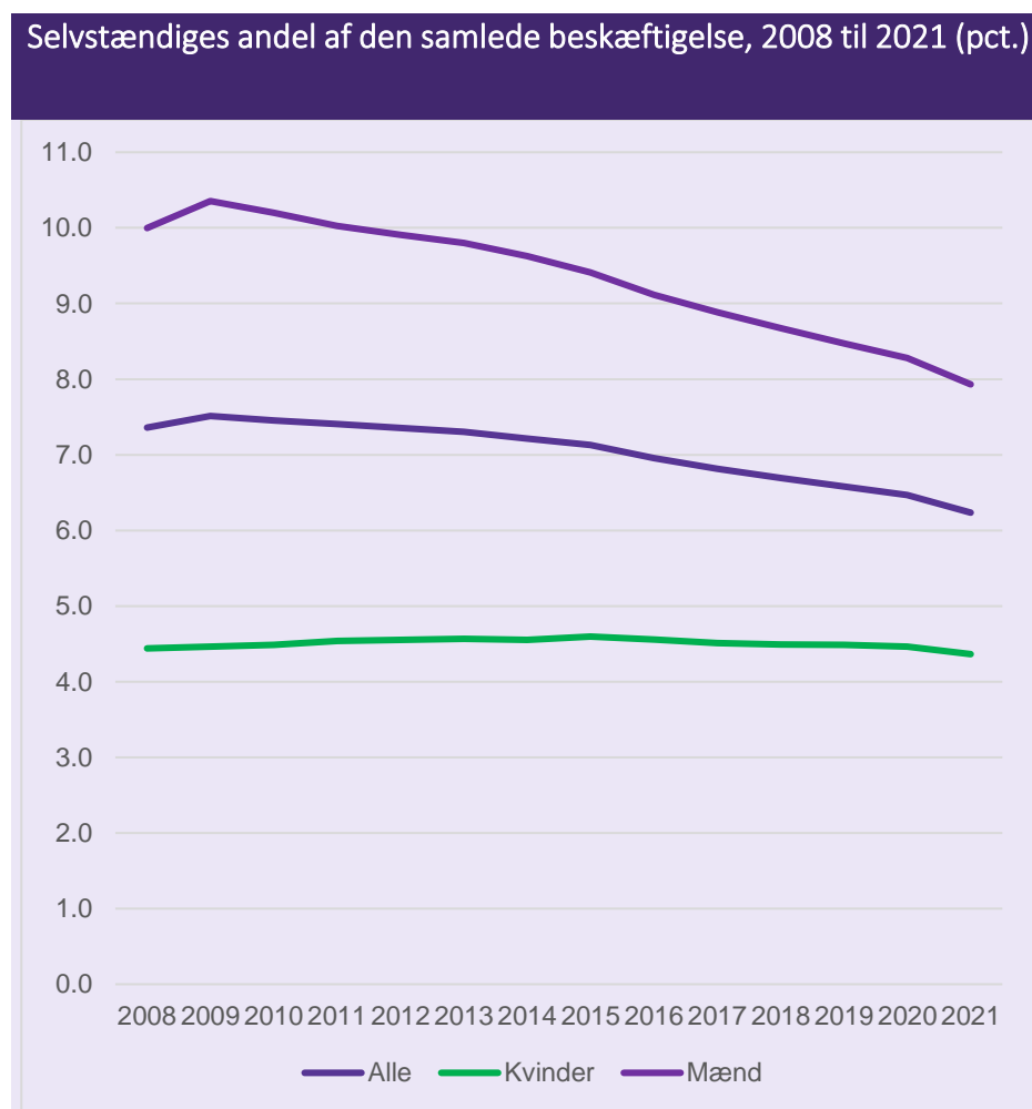
Figur 1

Mens kvinders andel ligger stabilt på mellem 4,3-4,4 pct. af kvindelige beskæftigede, er andelen for mænd faldet fra 10,0 pct. til 7,9 pct., jf. figur 1. Med andre ord kan stort set hele nedgangen tilskrives nedgangen i sandsynligheden for, at man som mand vælger at blive selvstændig.