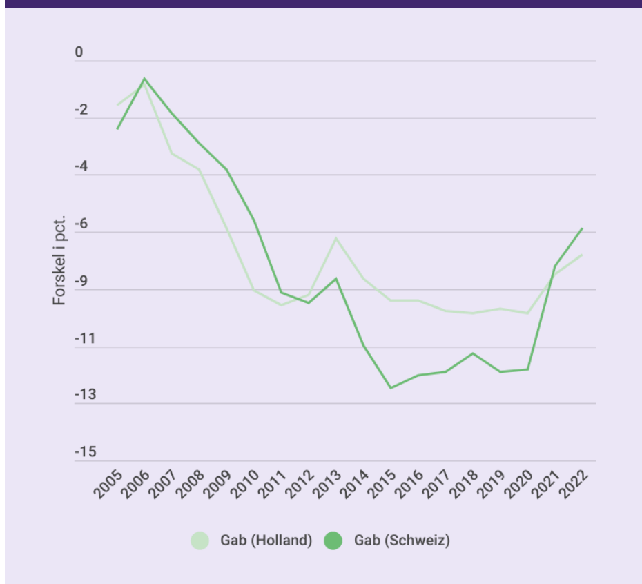
Udvikling i beskæftigelsesforskellen mellem 25-34-årige danskere, hollændere og schweizere (2005-2022)

Gabet er indsnævret, men der er lang vej endnu