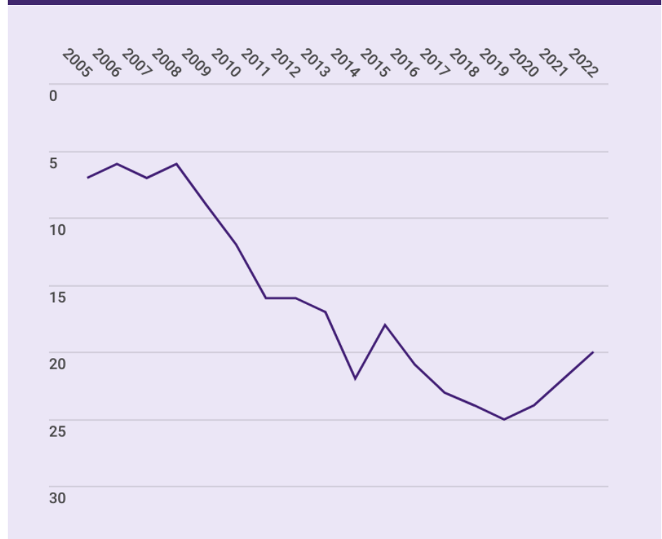
Beskæftigelsesgrad for 25-34-årige: Danmarks placering blandt EU/EØS-lande (2005-2022)

Danmark er siden 2005 gået fra en 7. til en 20. plads ud af 30 europæiske lande